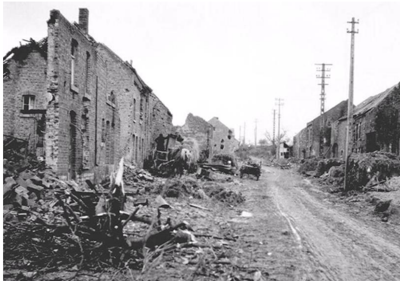
Verdenne na Kerstmis 1944