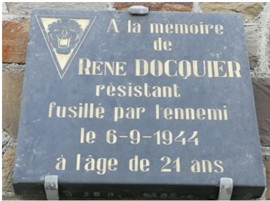
Op nr. 46 bevindt zich een gedenkplaat.