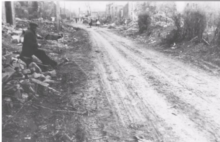
Photo prise au printemps 1945, des promeneurs visitent les ruines.