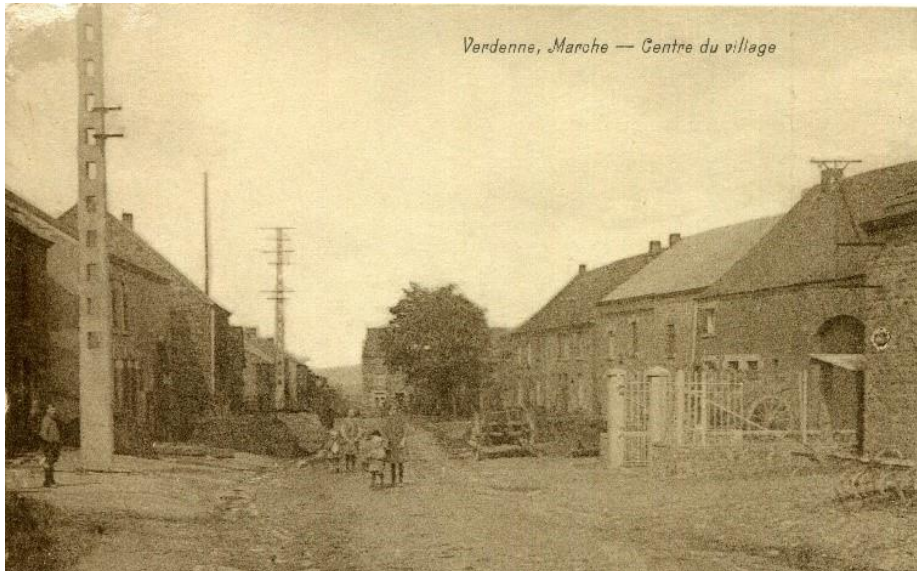
Rue principale voor Noël 1944

De straat doorkruist het hele dorp en was het toneel van bittere en moeilijke gevechten. Vandaag zul je begrijpen waarom ze “Rue Noël 1944” (Kerststraat 1944) heet.